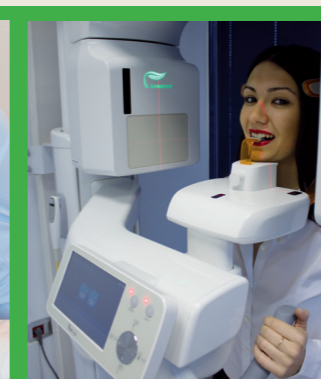
TAC con apparecchiature a tecnologia Green Ct