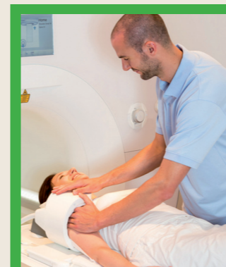
TAC con apparecchiature generiche

Prima di effettuare un intervento nella propria bocca o in quella dei propri cari, da oggi va tenuta sempre presente la possibilità di rivolgersi ad un centro Green Excellence Network , dove la salute è l'obiettivo più importante.